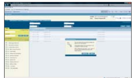
Komplet „check in check out“-funktionalitet i browseren.

MultiArchive 7 rummer også følgende funktionaliteter: